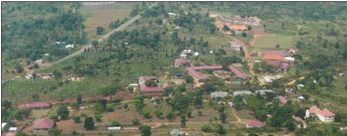
Am „Land of Hope“ befinden sich Schulen und die Administration.

Seit 2006 betreiben wir im Distrikt Mukono auch selbst mehrere Waisenhäuser, einen Kindergarten, Grundschule und verschiedene Berufsschulzweige. Etwa 700 Schüler werden hier in unseren eigenen Schulen unterrichtet. Auch die Administration von „Vision for Africa Intl.“ befindet sich hier.